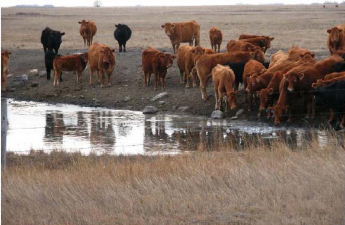
Image 1. Troupeau broutant près d'une source d'eau. Selon vous, quels contaminants vont se retrouver dans l'eau dans ces circonstances? Pensez-vous que cela soit sain pour le troupeau?

L'ammoniaque, provient essentiellement de plantes et animaux en décomposition, de l'agriculture (pour laquelle de grandes quantités de fertilisants à base d'ammoniaque sont utilisés), et des processus industriels. L'utilisation d'eaux souterraines contenant beaucoup d'ammoniaque et la chloramination de l'eau sont également partiellement responsables des niveaux d'ammoniaque. Les eaux souterraines dites anaérobiques (qui ne sont pas oxygénées) peuvent contenir de grandes quantités d'ammoniaque (>2 mg/l), alors que les eaux de surfaces ont des niveaux environ dix fois inférieurs. Lors d'événements particuliers dans les lacs, comme la mort de la flore d'algues, ou lorsqu'au printemps et en automne les couches d'eaux profondes se mélangent aux couches de surface, les niveaux d'ammoniaque peuvent grimper, même s'ils décroissent rapidement après ces événements. L'élevage intensif de bétail peut contribuer à trouver de grandes quantités d'ammoniaque dans les eaux de surface. Ainsi, de hauts niveaux d'ammoniaque dans l'eau de surface peuvent indiquer les pollutions de sources très variées.