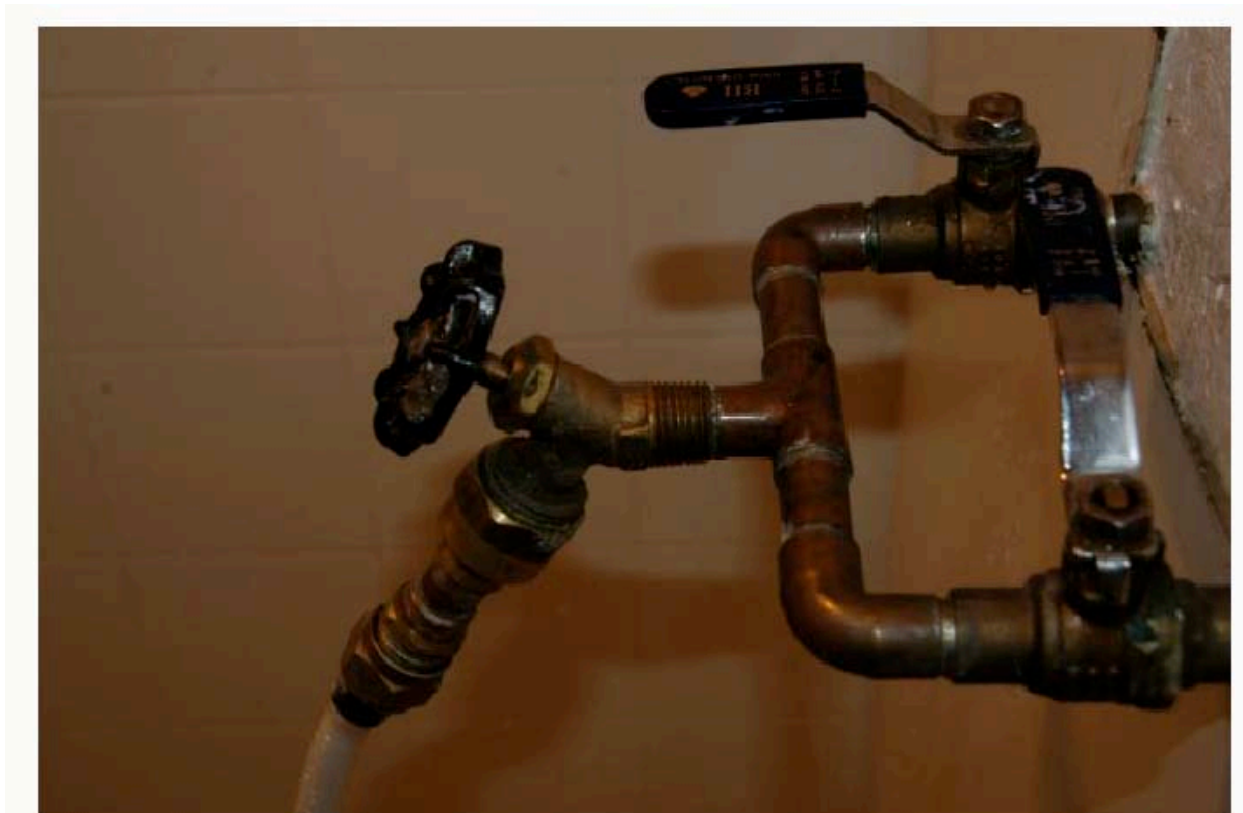
Le cuivre qui vient de la plomberie.

Toutefois, la principale source de cuivre est la plomberie locale, surtout si l'eau est corrosive. Comme les niveaux de cuivre sont généralement acceptables dans les usines de traitement d'eau, le respect des recommandations est vérifié en s'assurant que l'eau sortant de l'usine de traitement n'est pas trop corrosive. Le pouvoir de corrosion du cuivre est généralement plus élevé quand l'eau est acide ( \text{pH} < 7 , voir le test de pH), que l'alcalinité est faible (voir le test de l'alcalinité), et que la dureté est faible (voir le test de la dureté totale).