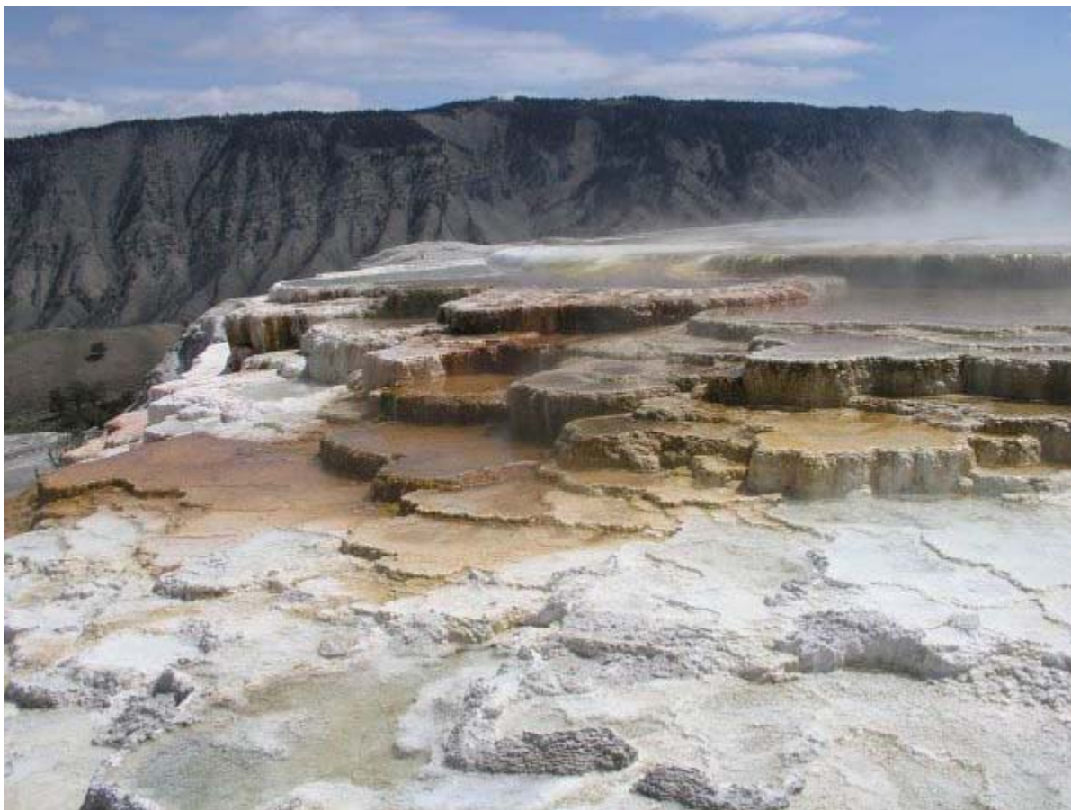
Dépôt provenant des minéraux dans les sources d'eaux chaudes de Mammoth;

De fortes concentrations de solides dissous peuvent aussi avoir des effets techniques. Les solides dissous peuvent produire de l'eau calcaireuse qui laisse des dépôts et des couches sur les installations et à l'intérieur des tuyaux d'eaux chaudes et des chaudières. Les savons et les détergents produisent moins de mousse avec de l'eau calcaireuse qu'avec de l'eau douce. Les fortes quantités de solides dissous peuvent aussi tacher les appareils ménagers, corroder les tuyaux et avoir un goût métallique. L'eau calcaireuse use les filtres à eau plus rapidement dû à la quantité de minéraux dans l'eau. L'image ci-dessous a été prise près des sources d'eaux chaudes de Mammoth dans le parc national de Yellowstone et illustre bien les effets que les fortes concentrations de solides dissous peuvent avoir sur le paysage. Ces mêmes minéraux qui sont dans ces roches peuvent causer des problèmes lorsqu'ils se développent dans les tuyaux et les installations.